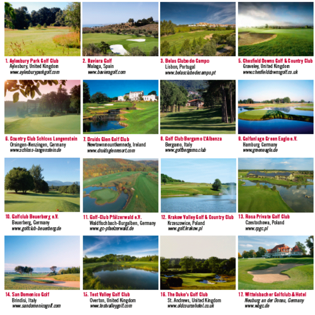
Die Bilder zeigen bei den jeweiligen Clubs