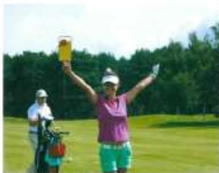
• Das reicht nach 5 Tagen der Superlative

5 Tage, 5 Plätze, 5 wettbewerbsstarke Turniere – es war wieder Zeit für die Berliner Golfwoche. Zum 7. Mal ging es bei der 7. Berliner Golfwoche in Motzen auf die Banke. Das Startfeld ist voll besetzt und per Kanone ging es um 12 Uhr am Start. Als Hauptpreis der Golfwoche wartete eine Golfreise ins Reich der Mitte des Hauptponsors CHINA TOURS. Mit etwas Geschick konnten die Teilnehmer über die Turnierreihe die Reise der Superlative nach