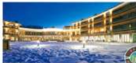
• Kitzhübel Country Club

Kitzhübel Country Club, Österreich – Home, Suite Home Wohnen Sie im Kitzhübel Country Club, Österreichs erster privater Members Club mit Anschluss an International Associate Clubs. Mitglieder des IAC-Netzwerks und Clubs genießen die edle Herberge in einer unvergleichlichen Natur. Der Club bietet den Mitgliedern ein individuell entworfenes Gastronomie-, Wellness-, Freizeit- und Event-Programm. Auch kulinarisch wird einiges geboten. Das Beste der Region wird mit den Spezialitäten der Saison kombiniert. Überzeugen Sie sich selbst und genießen Sie den 25% Rabatt Vorteil für Sie als IAC-Mitglied auf alle Saison-Preise. Webpage: www.kitzhuel.com