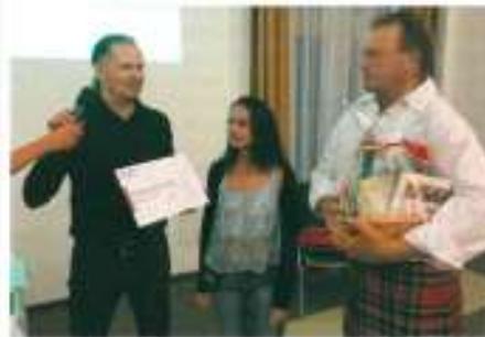
• Jüng Hühner geht China

China gewinnen. All diejenigen, die beim Par-3-Contest das Getrie mit dem ersten Schlag treffen, qualifizierten sich für die Verkörung der 15-tägigen Golf-Randreise durch China. Unser Jüng Hühner war der Glückpilot und freut sich schon jetzt auf seine Golf Freunde in Mission Hills.