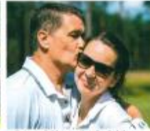
■ Der gute Schlag würde selbst belohnt