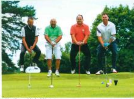
■ Dieses Team möchte hoch hinaus