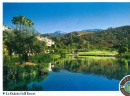
■ La Quinta Golf Resort

Die Golf Academy ist zudem mit den modernsten Einrichtungen wie einem digitalen Schwunganalyse-System und anderen modernen Golfausstattungen eingerichtet. Somit können Golfspieler eine ausgeglichene Balance zwischen Moderne, Tradition, Natur und harmonischer mediterraner Atmosphäre genießen.