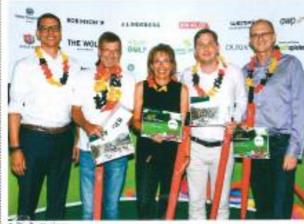
■ Die Bruttosieger